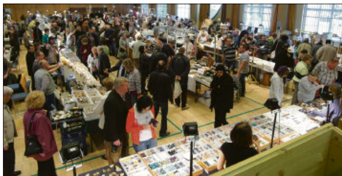
Stets über 1000 Besucher lockte die Oelsnitzer Mineralienshow an. Neben den Fachleuten, die aus ganz Deutschland anreisen, kommen alle steinbegeisterten Besucher hier auf ihre Kosten.

Eintritt: Erw.: 3,50 Euro, Kinder: 1,00 Euro. Jeder Besucher nimmt wieder mit der Eintrittskarte an der Verlosung wertvoller Preise teil. Veranstaltungsort: Vogtlandsporthalle Oelsnitz, Adolf-Damaschke-Straße 55